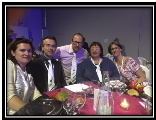
Mr le Président de l'apel 29