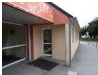
Entrée de la garderie

Les frais de garderie sont déductibles des impôts jusqu'aux sept ans de l'enfant. Penser à garder vos factures.